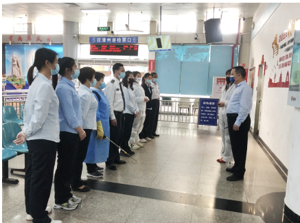
厦轮/客旅码头客运站强化部署落实疫情防控举措