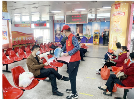
厦轮/客旅志愿者在客运站宣传疫情防控知识